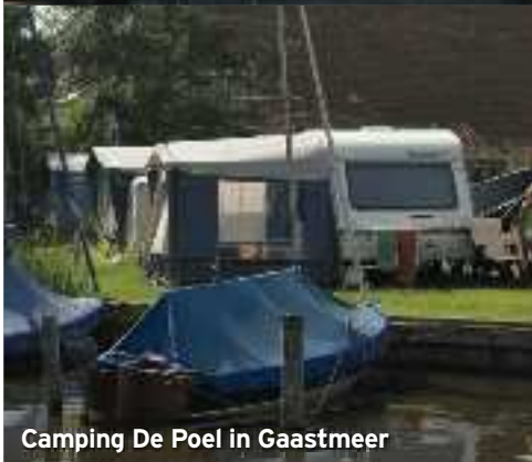
Camping De Poel in Gaastmeer