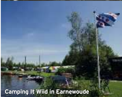
Camping It Wiid in Earnewoude